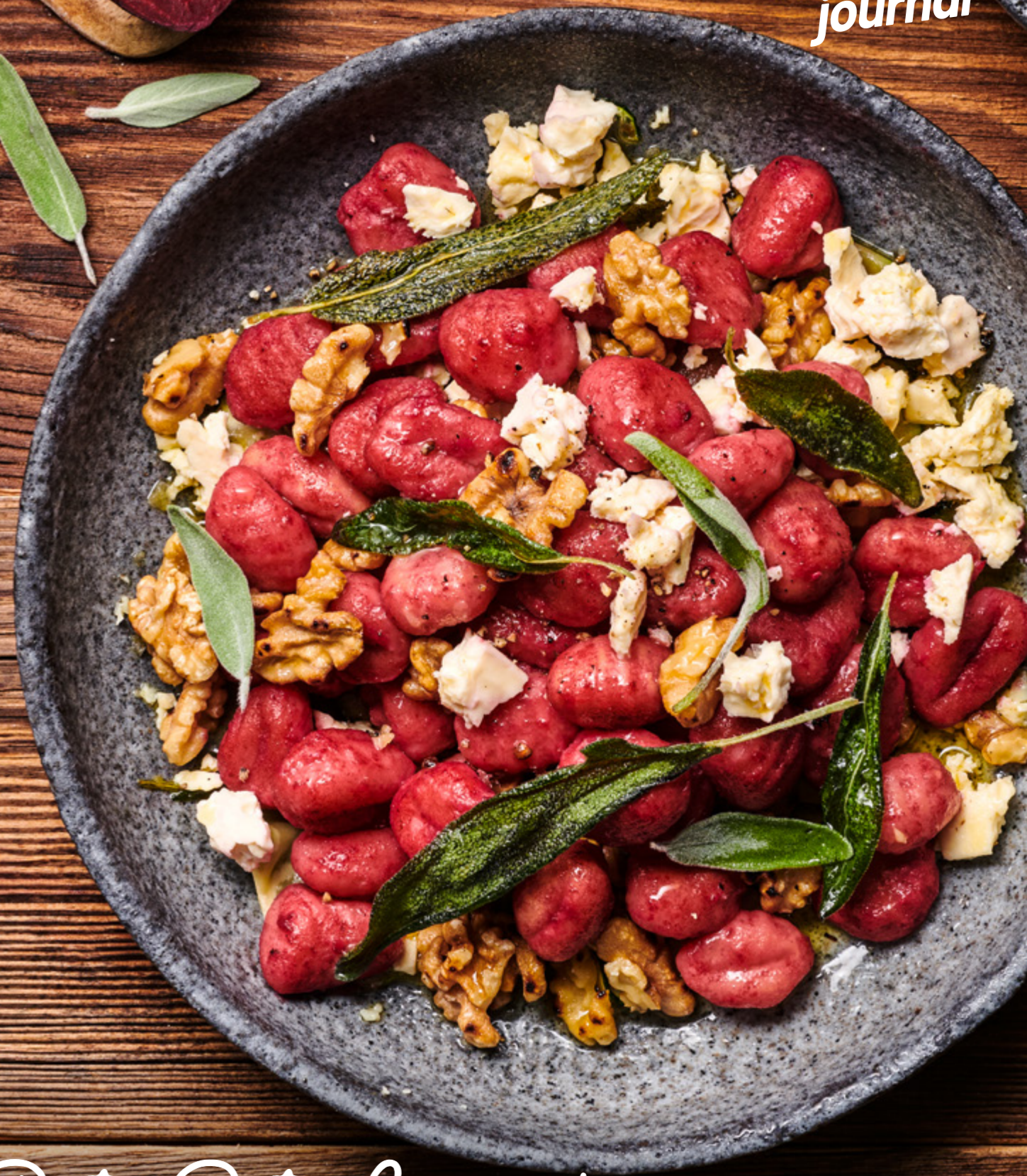
Rote-Bete-Gnocchi mit Walnüssen und Salbei