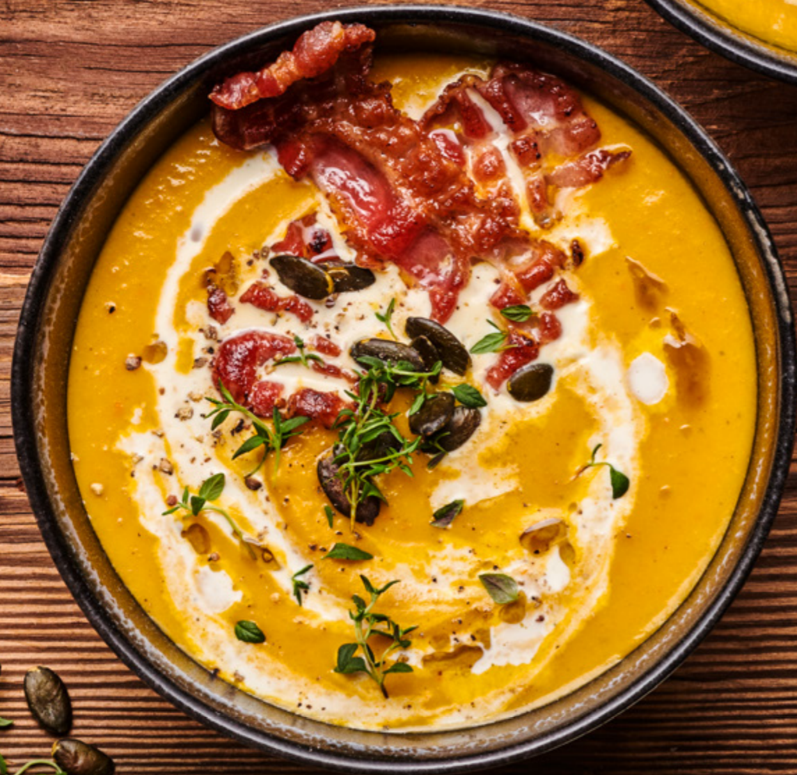
Fruchtige Kürbissuppe mit Speckstreifen

Beste Zutaten in Demeter-Qualität gibt's in deinem Bioladen!